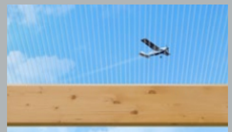
16 mm Stegabstand